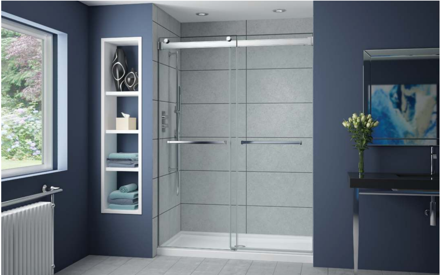
Model shown / Modèle présenté : NPS160-11-40

Bypass sliding doors / Portes coulissantes bidirectionnelles